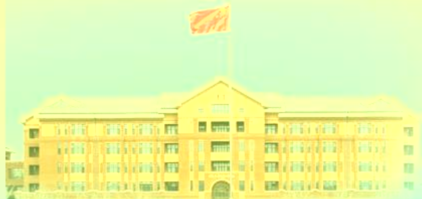
天津职业技术师范大学